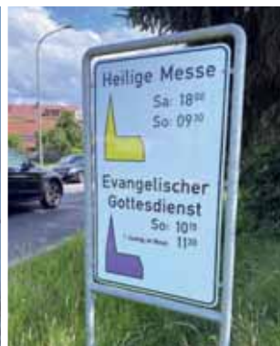
v.l.: Kirche ändert sich – in Gebäuden (Feldkapelle), in der Gemeinschaft (Hinweistafel Gottesdienst)