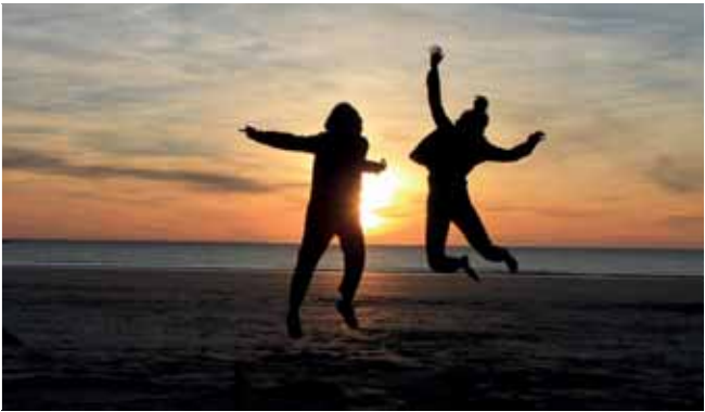
v.l.: Jugendlicher bei der Konfirmation, Sommer am Meer bei Sonnenuntergang